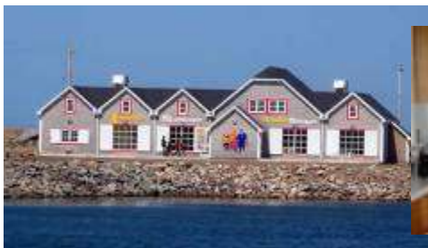
Le Centre de la Mi-Carême

La Mi-Carême est une ancienne tradition conçue en France comme un temps de fête visant à alléger les sacrifices du temps du carême. Depuis ce temps, cet événement a été perdu dans plusieurs endroits et modifié dans d'autres. Parmi nos nombreuses coutumes, la région acadienne de Chéticamp, cependant, a gardé cette tradition forte pour plus de 200 ans et la célèbre encore en vigueur.