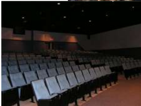
Le Conseil des Arts de Chéticamp