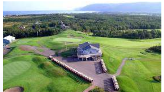
Terrain golfe- Le Portage