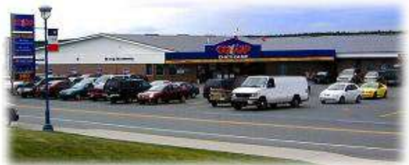
Le magasin Coop