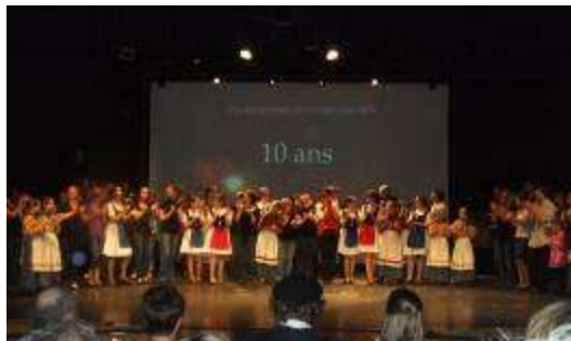
Place des arts P. Anselme Chiasson