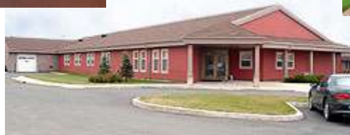
Centre de Santé communautaire Sacré-Cœur