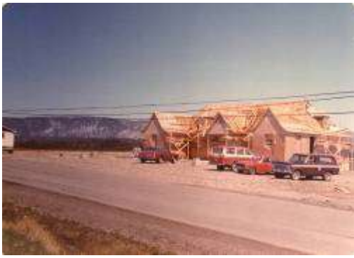
Les Trois Pignons, hier et aujourd'hui