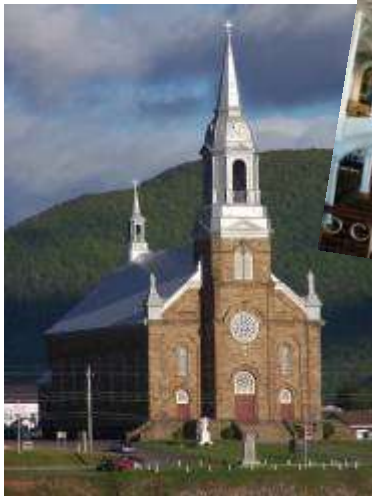
Église Saint Pierre

Nos pionniers fondateurs, et plusieurs générations de leurs descendants, étaient des gens profondément religieux. Bien ancrés dans leur dévouement envers leur foi catholique romaine, une de leurs premières préoccupations, dès les débuts de la colonie, a été la construction de lieux de culte.