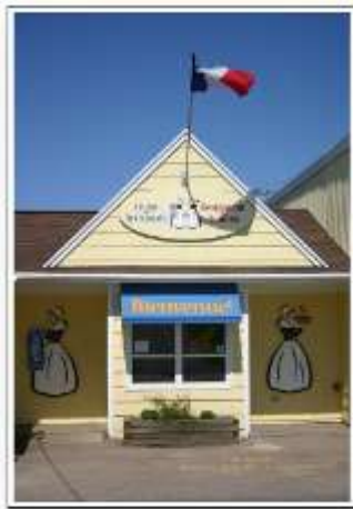
La Coopérative Artisanale

L'art du tapis hooké, un artisanat local, est devenu une industrie communautaire au fil des années. Cet artisanat a été lancé, a progressé et s'est perfectionné pendant au-delà d'un demi-siècle sans que personne à Chéticamp ne consigne au fur et à mesure sur papier les faits ou le récit de son évolution. En 1963 une coopérative de production et de vente de tapis vit le jour et est devenu ce qu'on connaît aujourd'hui la Coopérative artisanale de Chéticamp. Aujourd'hui il y'a encore une centaine de personnes dans le région qui confectionnent des tapis hookés. On retrouve des tapis hookés de Chéticamp, de toute sorte, non seulement dans les boutiques de Chéticamp mais aussi dans des boutiques à travers la province et à travers le Canada.